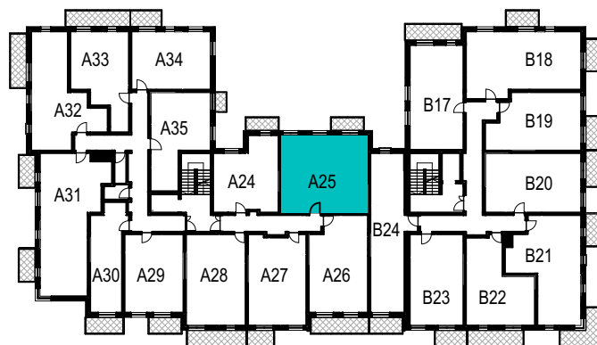
SCHEMAT ROZMIESZCZENIA LOKALI MIESZKALNYCH PIĘTRO II