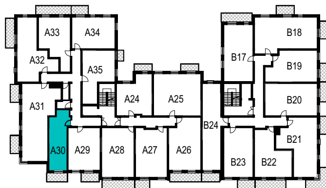
SCHEMAT ROZMIESZCZENIA LOKALI MIESZKALNYCH PIĘTRO II