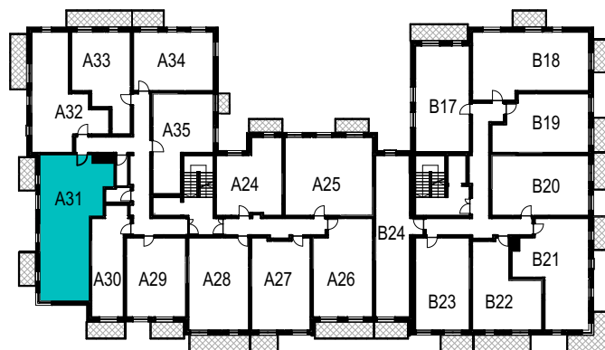
SCHEMAT ROZMIESZCZENIA LOKALI MIESZKALNYCH PIĘTRO II