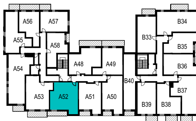
SCHEMAT ROZMIESZCZENIA LOKALI MIESZKALNYCH PIĘTRO IV