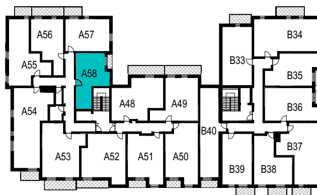
SCHEMAT ROZMIESZCZENIA LOKALI MIESZKALNYCH PIĘTRO IV