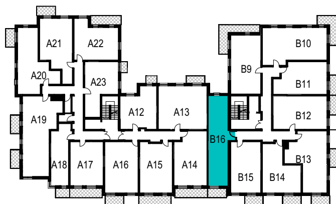
SCHEMAT ROZMIESZCZENIA LOKALI MIESZKALNYCH PIĘTRO I