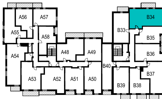
SCHEMAT ROZMIESZCZENIA LOKALI MIESZKALNYCH PIĘTRO IV