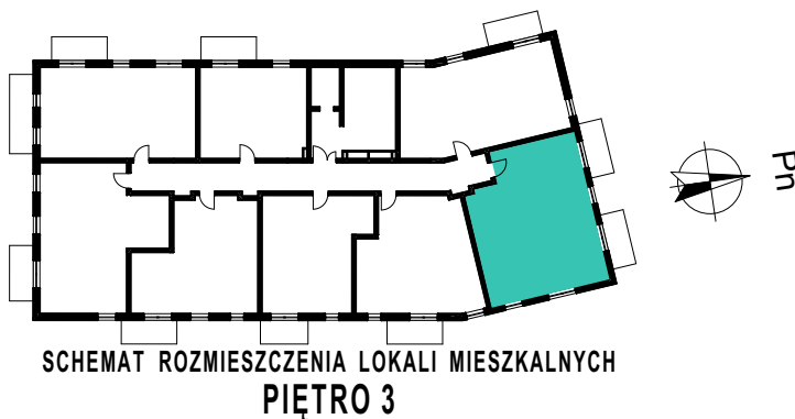
SCHEMAT ROZMIESZCZENIA LOKALI MIESZKALNYCH PIĘTRO 3