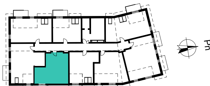
SCHEMAT ROZMIESZCZENIA LOKALI MIESZKALNYCH PIĘTRO 4