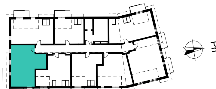
SCHEMAT ROZMIESZCZENIA LOKALI MIESZKALNYCH PIĘTRO 4