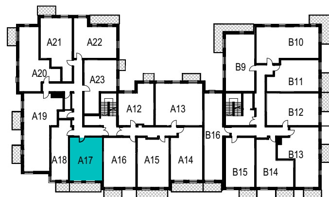
SCHEMAT ROZMIESZCZENIA LOKALI MIESZKALNYCH PIĘTRO I