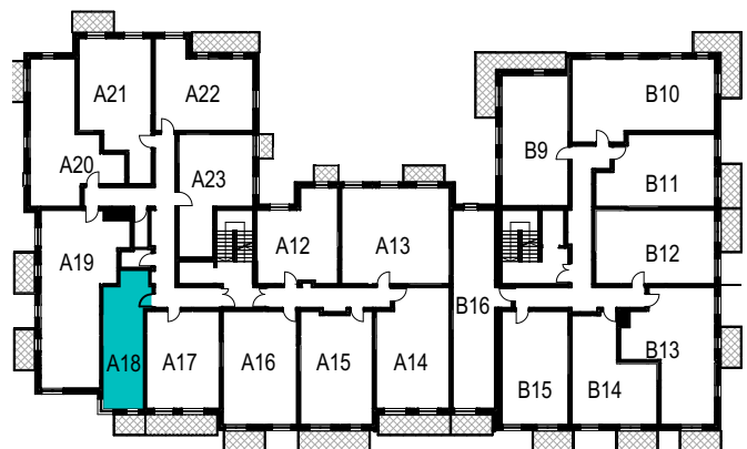
SCHEMAT ROZMIESZCZENIA LOKALI MIESZKALNYCH PIĘTRO I