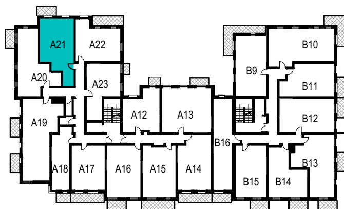
SCHEMAT ROZMIESZCZENIA LOKALI MIESZKALNYCH PIĘTRO I