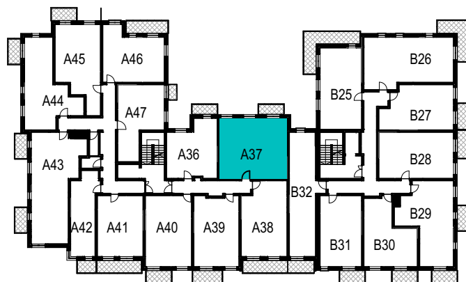
SCHEMAT ROZMIESZCZENIA LOKALI MIESZKALNYCH PIĘTRO III