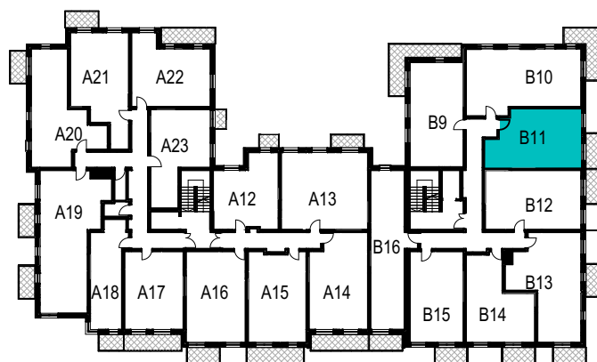
SCHEMAT ROZMIESZCZENIA LOKALI MIESZKALNYCH PIĘTRO I