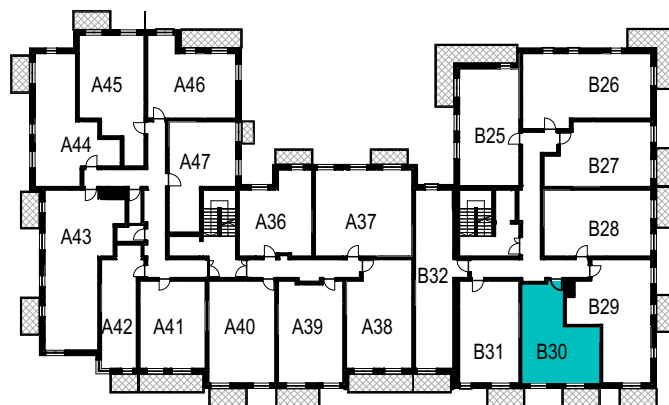
SCHEMAT ROZMIESZCZENIA LOKALI MIESZKALNYCH PIĘTRO III