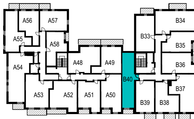
SCHEMAT ROZMIESZCZENIA LOKALI MIESZKALNYCH PIĘTRO IV